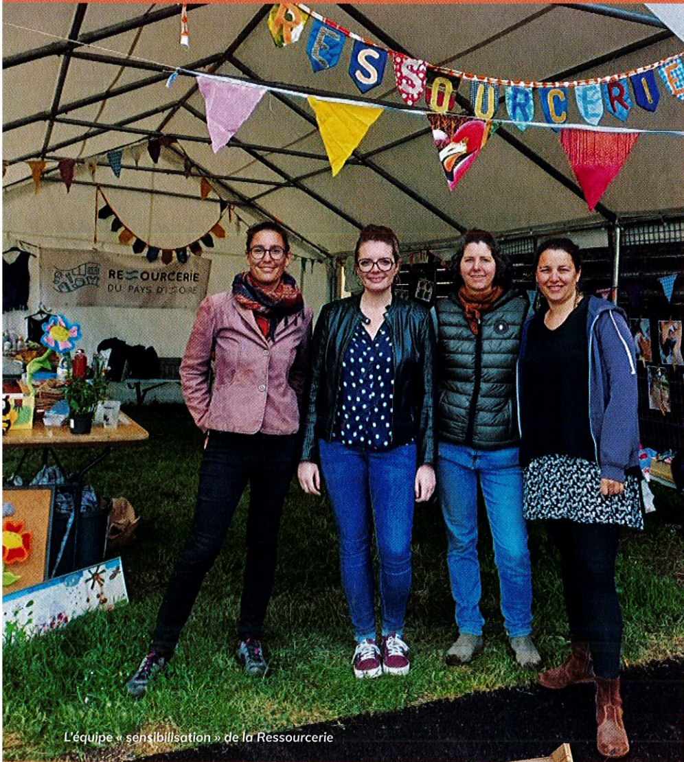
L'équipe « sensibilisation » de la Ressourcerie